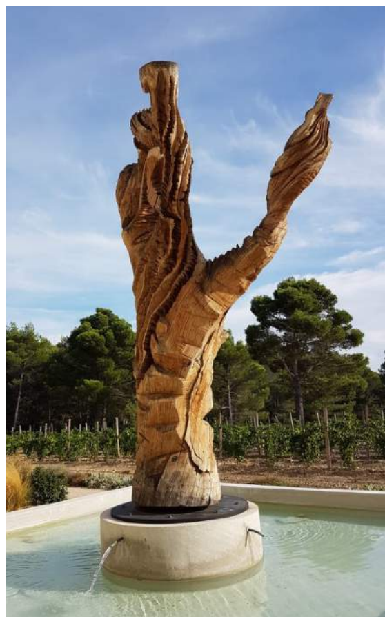
Marc Nucera, Drapé sur chêne, 2017