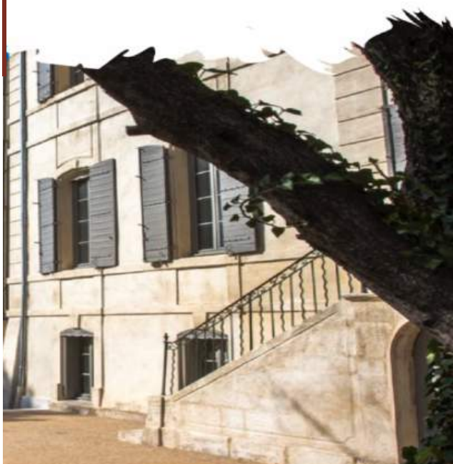
Maison du parc naturel régional des Alpilles