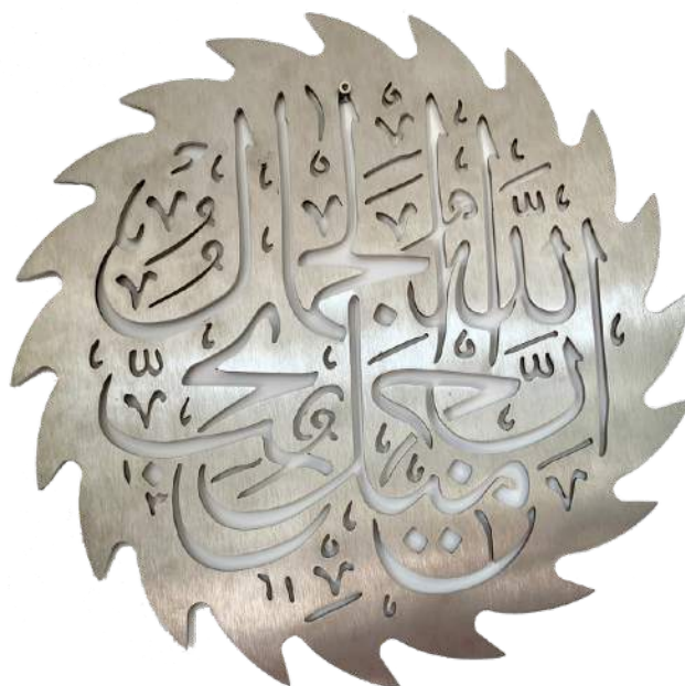
mounir fatmi, Between the Lines , 2010