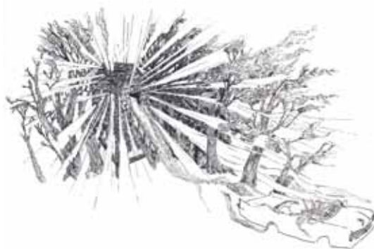
ROMAIN TRINQUAND Kiss me deadly 2015. Dessin à plume, dimensions variables © R. Trinquand [Les Baux-de-Provence]

Du 17 juillet au 27 août 2016, l'art contemporain danse dans les Alpilles au rythme de multiples corps a-part , humains ou inhumains, abstraits ou concrets, légers ou lourds, violents ou divertissants, physiques ou spirituels. Avec, en prime tous les jeudis soirs du mois d'août, des artistes invités – dont Romain Trinquand – pour des interventions en direct aux Baux-de-Provence.