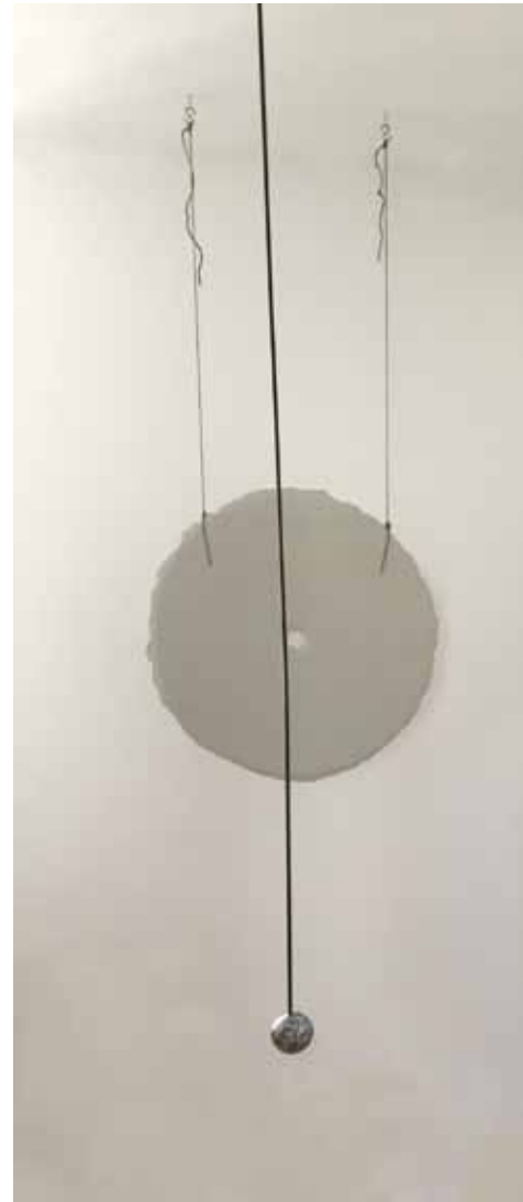
CI-DESSUS DOUCE HOLLEBECQ Tempo 2013. Porcelaine, étain, tige métallique, moteur, dimension 1m, hauteur variable © D. Hollebecq [Saint-Rémy-de-Provence]